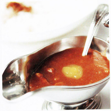
Thu. 課長のおごりで千足屋へ。