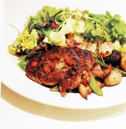
Tue. 隠れ家ビストロで野菜補給。

神田駅のほど近く、ベルギー料理専門店のお昼はランチプレート1種類。日替わりで登場するメインと、圧倒的なボリュームのサラダ(10種類以上の野菜入り!)に作り手の愛情を感じるひと皿です。パン付き。/Bistrot Cueillette du Bouquet●中央区日本橋本石町3-2-5 マレ本石2F ☎03-5203-8040 ⑩11:30~13:30L、17:30~22:30L 日休