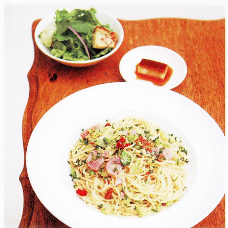
Mon. 部署の後輩と一緒に女子ランチ。

旬の食材を使った、シンプルながら味わい深い家庭料理を提供するこちらのお店。ランチは5種類のパスタ、カレーやプレートランチなどバリエーション豊富で、毎日でも通いたくなってしまおう。サラダ、ミニデザート付き。/Le Souvenir●中央区日本橋2-2-16 共立日本橋ビルB1 ☎03-3231-7808 ⑩11:00~22:00L (ランチ14:30L) 日祝休