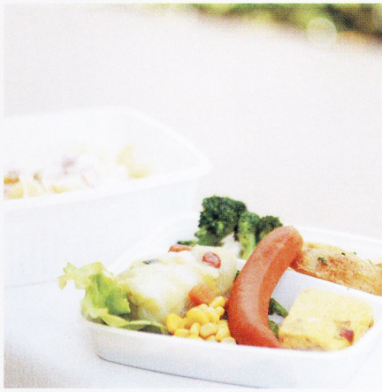
Fri. 時間がない日の強い味方。