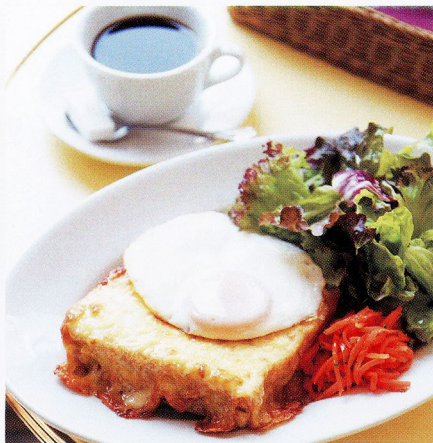
Wed. 体が目覚める贅沢なひと皿。

味も価格もボリュームも、遠いパリの空気感をそのまま伝えるような心地のよいカフェ。トーストにハムとモルネーソースを挟み、グリユイエルチーズをたっぷりのせて。ドリンク付き。/CAFÉ AIMÉE VIBERT●中央区日本橋室町2-2-1 コレド室町1F ☎03-6225-2552 ⑩10:00~22:00L 不定休 www.aimeevibert.com/cafe/