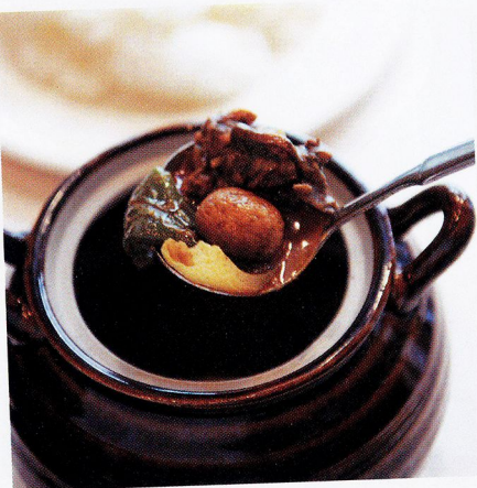
Sat. やみつきになる激辛カレー。